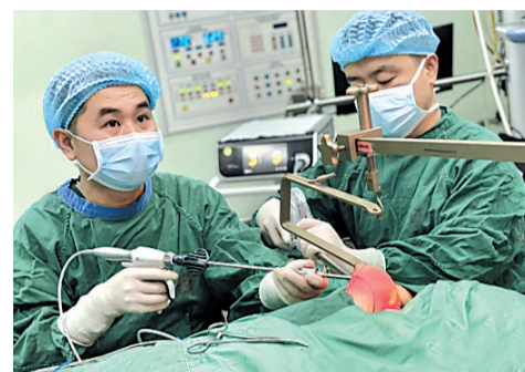
精心手术

近日，市人民医院乳腺甲状腺外科团队在麻醉手术科等多科协同努力下，成功开展了我市首例经腋窝入路腹腔镜甲状腺切除术。