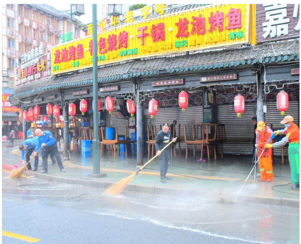
大家齐动手,清洁路面

本报讯(记者 罗晓玲)张公桥好吃街是中心城区的热门美食打卡地之一。9月27日,市城管局联合乐山市市容环境卫生公共服务中心以及好吃街商家,开展环境卫生大清洗。