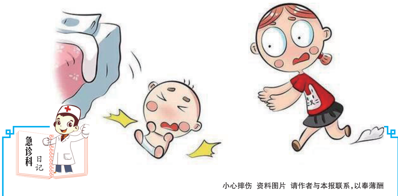
小心摔伤 资料图片 请作者与本报联系,以奉薄酬