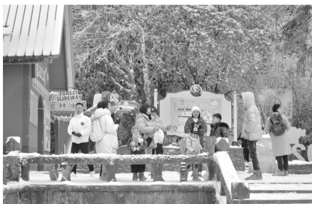
游客在峨眉山景区游玩

据了解,23年来,峨眉山自开创四川首个高山滑雪场开始,从滑雪场的初步尝试,再到冰雪主题乐园的全面升级,实现了从“单冰作战”到多元冰雪体验的华丽转身。为满足游人日益增长的个性化需要,景区持续探索,全山联动,不断丰富冬季旅游产品,祈福、武术、温泉、美食和冰雪完美融合,增强冬季峨眉山的吸引力和承载力,峨眉山冰雪温泉节推出的特色冬游活动,收获大批游客的青睐与好评。