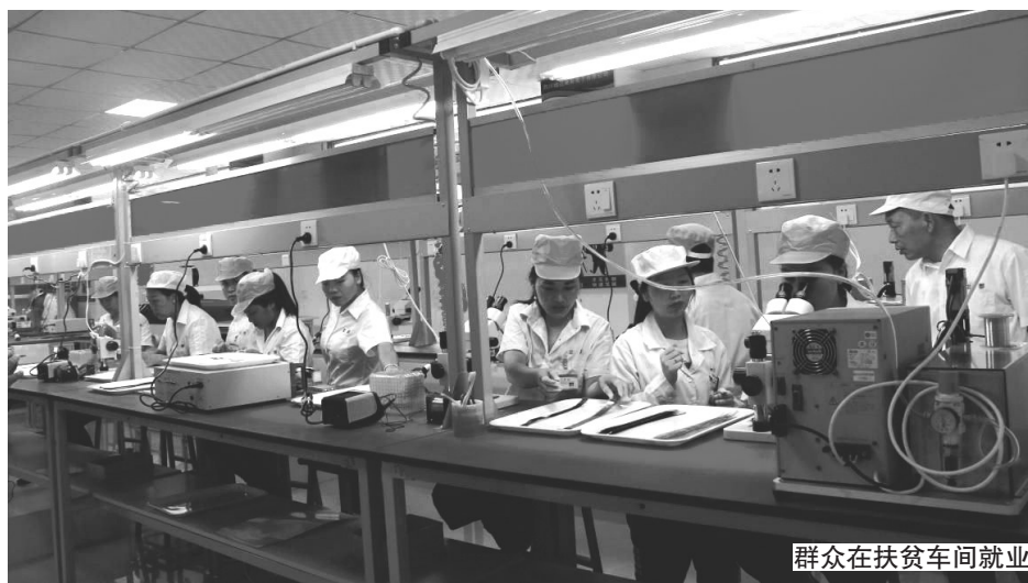
群众在扶贫车间就业