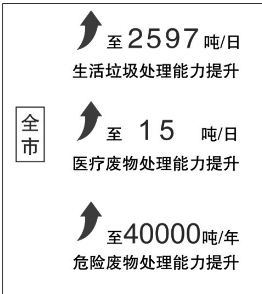
“十三五”末,乐山固废处理能力大力提升

这几年,是我市迄今为止治污成效最大、保护力度最大、生态环境保护能力提升最大的几年,注重“减污、降碳、增绿”协同发力,推动生态环境质量持续改善,人民群众生态环境获得感显著增强,“生态绿”成为高质量发展的底色。