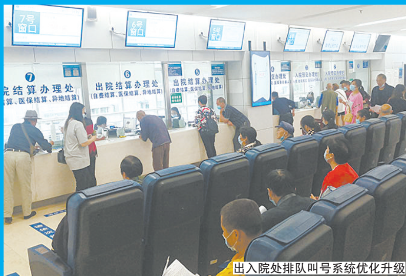
出入院处排队叫号系统优化升级

本报讯(记者 戴余乐 摄影报道)为提高医疗服务质量,改善患者就医体验,切实解决住院患者办理出入院手续排队等候问题,近日,乐山市人民医院对出入院处排队叫号系统进行升级,将流程进行优化。