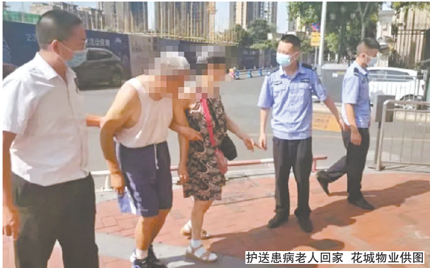
护送患病老人回家

本报讯(记者 倪珉)近日,一位老人在江边突然身体不适,幸好被物业人员及时发现,将老人送回家中。