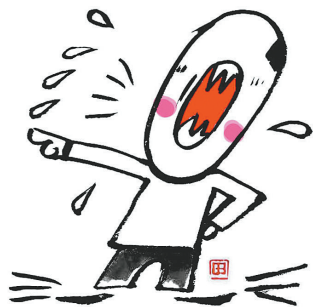
人不贵在牙尖嘴利，而贵在耳聪目明。