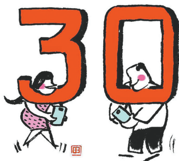
千万别在最好的年纪，活得太安逸。