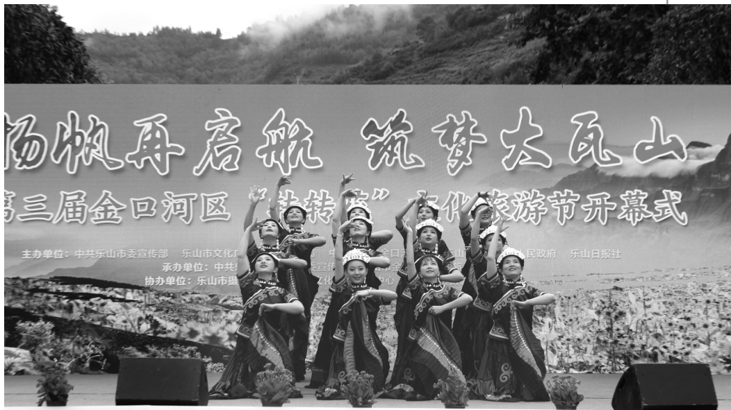
开幕式现场

本届“转转花”文化旅游节历时7个月,包含5大文旅活动,通过对自然风光、历史遗迹、宜居生态、民俗文化、特色农业、矿产资源等特色品牌的推介,充分展示金口河区的自然之美、人文之美和特色资源。