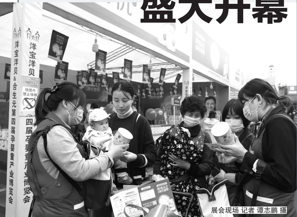
展会现场

本报讯(记者 张波)昨(15)日,“洋宝洋贝&合生元”第四届孕婴童产业博览会在乐山中心城区嘉州长卷·1号停车场盛大开幕,琳琅满目的商品、丰富多彩的活动,为乐山市民带来了全新的观展体验。本届展会将持续到18日,欢迎市民前往选购。