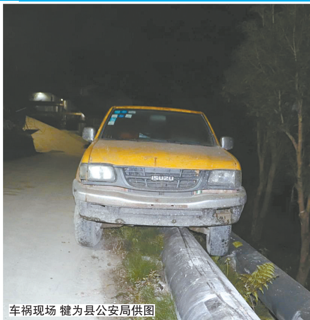
车祸现场