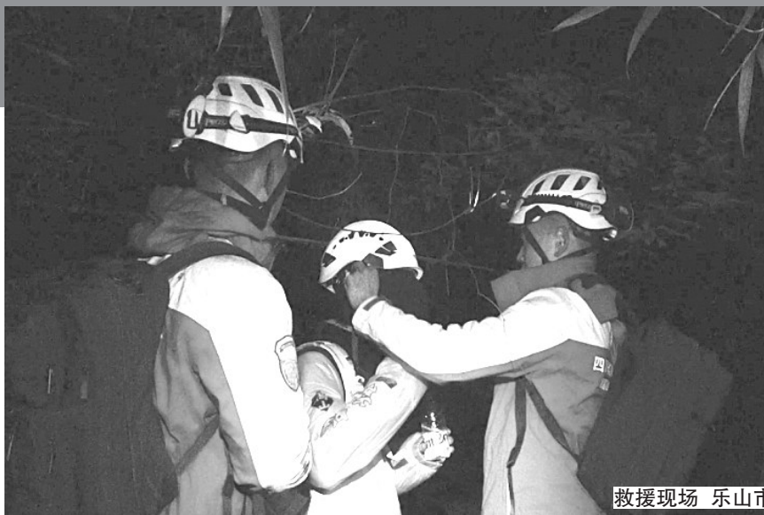
救援现场