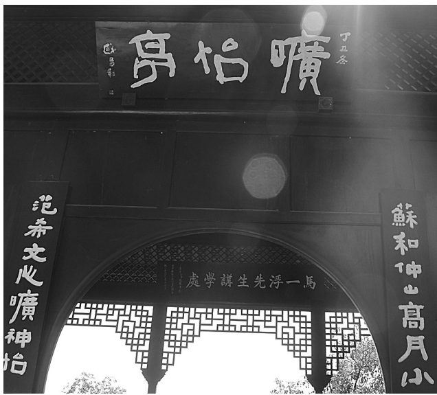
马一浮讲学的地方