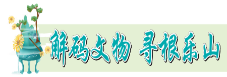
解码文物 寻根乐山

今年6月至8月，我市对老霄顶公园环山步道进行了修缮。目前正在对建筑周围道路进行维修……相信修缮后的老霄顶，将更添历史厚重和人文之美。