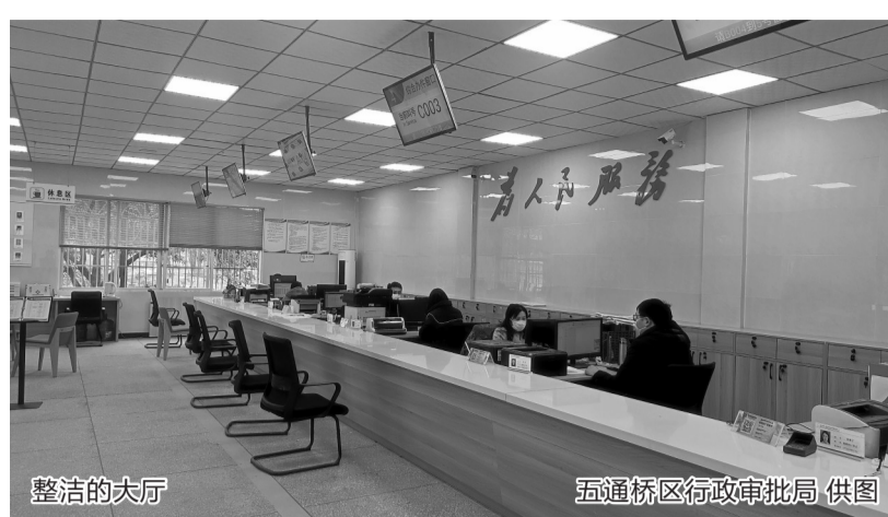
整洁的大厅

走进金山镇人民政府便民服务中心,明亮、整洁的大厅让前来办事的群众身心愉悦。为提高服务效能,该便民服务中心强化综合窗口建设,以“转变职能、优化服务、方便群众、提高效率”为目标,设立5个综合窗口,将分散办理变为集中办理,向群众提供计划生育、民政残联、社保医保、新农合等一站式服务。此外,该便民服务中心还在每个窗口设置工作人员公示牌,将工作人员姓名、照片、岗