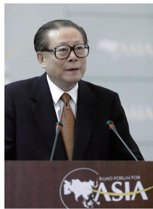
上图:2001年2月27日,博鳌亚洲论坛成立大会在海南举行。江泽民同志出席成立大会并致辞。