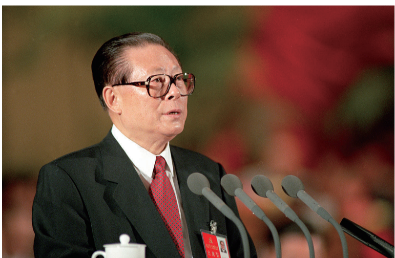
上图:1997年9月12日,中国共产党第十五次全国代表大会在北京人民大会堂开幕。这是江泽民同志代表第十四届中央委员会作报告。