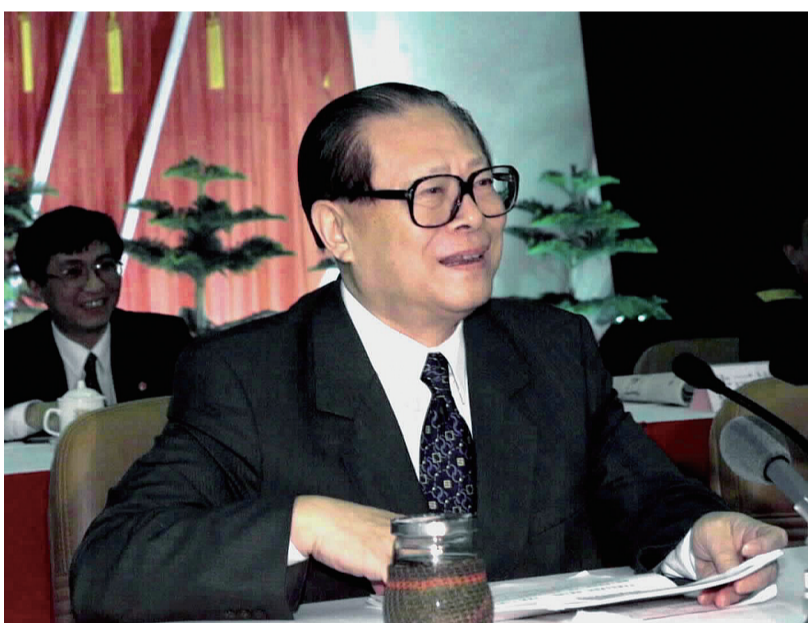
上图:2000年2月20日,江泽民同志在广东省高州市领导干部“三讲”教育会议上发表重要讲话。在这次广东考察中,江泽民同志提出,我们党总是代表着中国先进生产力的发展要求,代表着中国先进文化的前进方向,代表着中国最广大人民的根本利益。