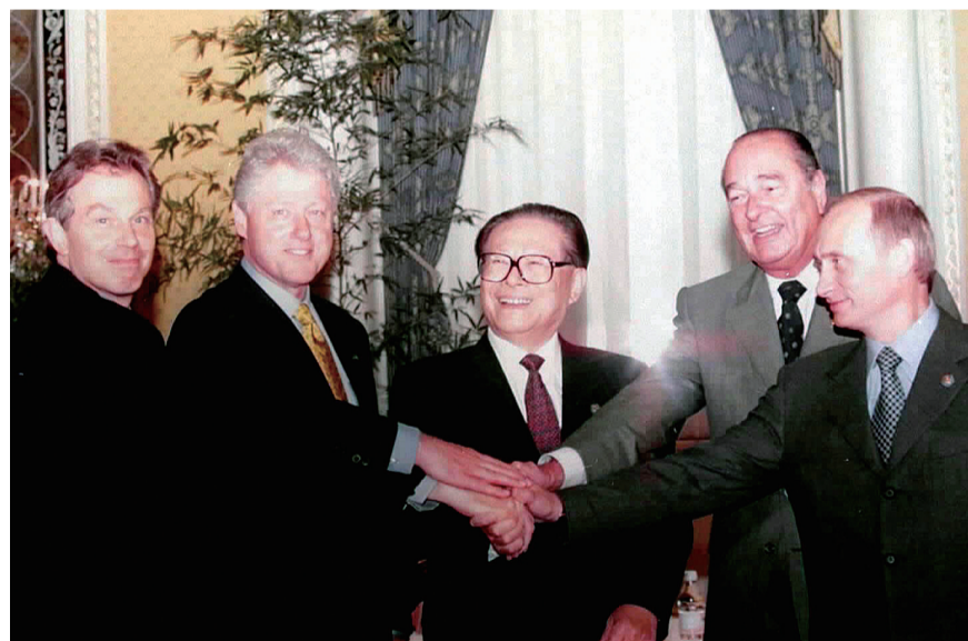
左图:2000年9月7日,由中国倡议的联合国安理会五个常任理事国首脑会议在纽约举行。江泽民同志(中)同法国总统希拉克(右二)、俄罗斯总统普京(右一)、英国首相布莱尔(左一)、美国总统克林顿(左二)握手合影。