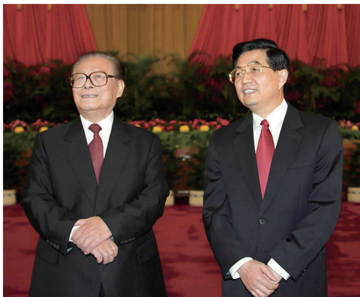
左图:2002年11月15日,江泽民同志、胡锦涛同志在北京人民大会堂亲切会见出席党的十六大代表、特邀代表和列席人员并发表重要讲话。