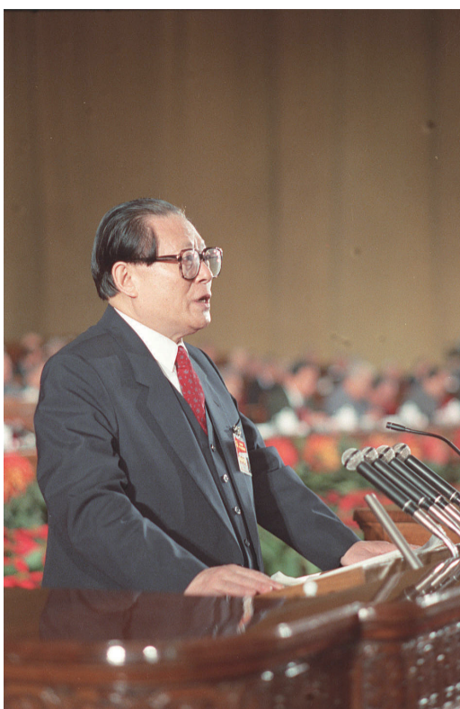
左图:1992年10月12日,中国共产党第十四次全国代表大会在北京人民大会堂开幕。这是江泽民同志代表第十三届中央委员会作报告。