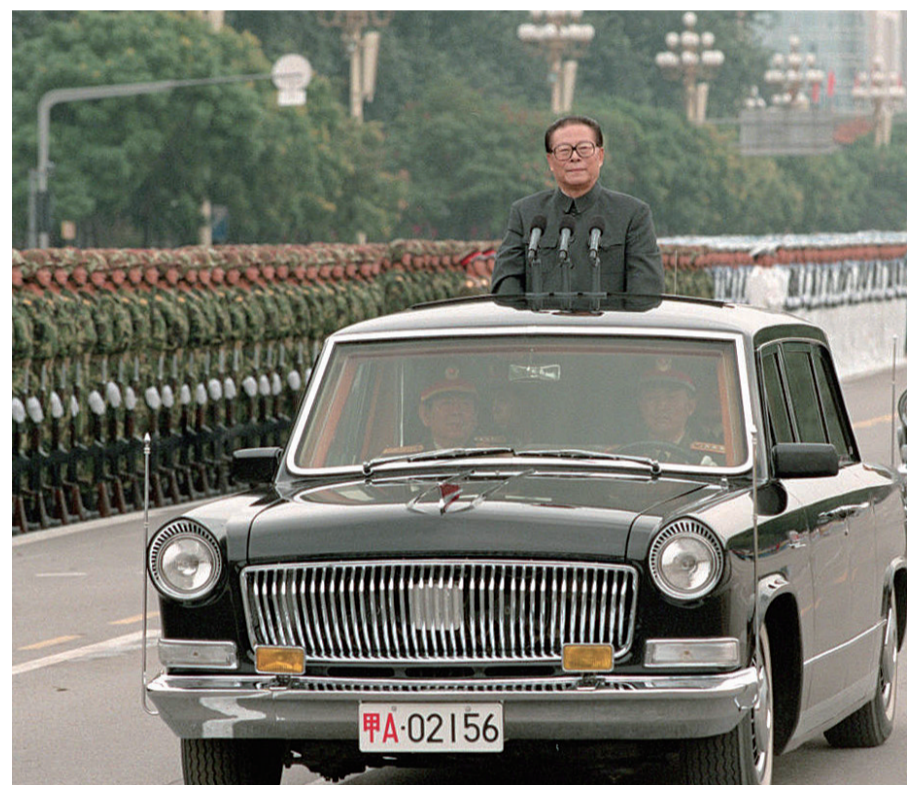
左图:一九九九年十月一日,中华人民共和国成立五十周年盛大庆典在北京天安门广场举行。江泽民同志检阅由人民解放军陆海空三军和人民武装警察部队、民兵预备役部队组成的地面方队。