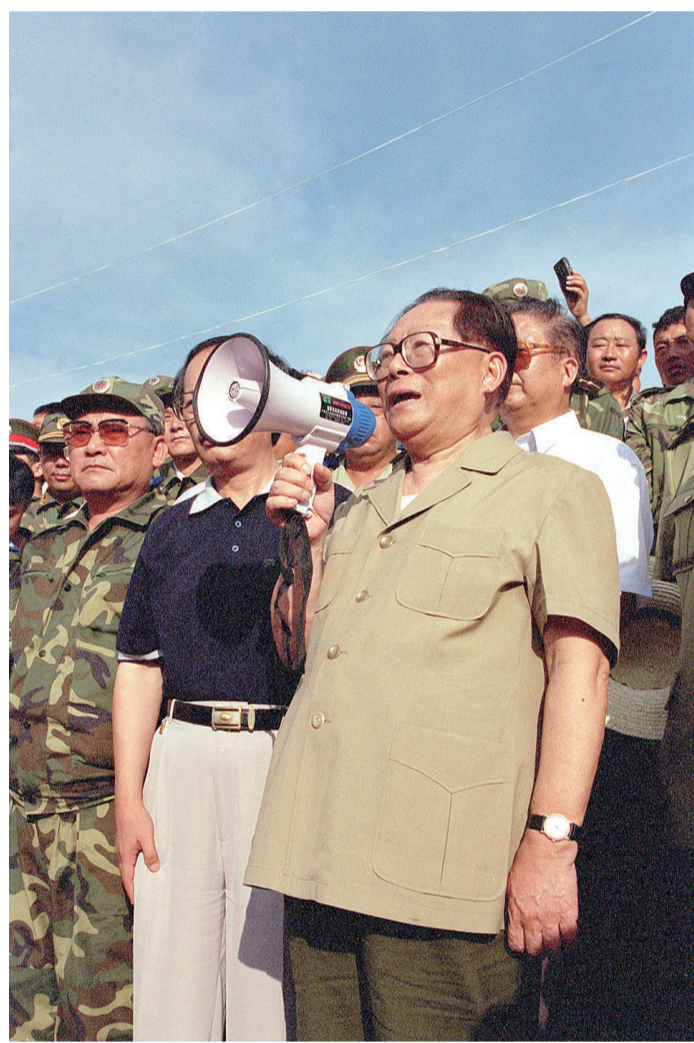
左图:1998年8月13日至14日,江泽民同志亲赴湖北长江抗洪抢险第一线,看望、慰问、鼓励奋战在抗洪抢险第一线的广大军民,指导抗洪抢险斗争。这是8月13日江泽民同志在洪湖市乌林镇中沙角险段大堤上,向正在抗洪抢险的军民发表讲话。