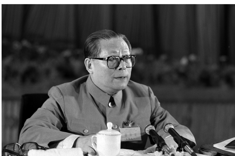
上图:1989年6月23日至24日,中国共产党第十三届中央委员会第四次全体会议在北京召开。这是江泽民同志在会上讲话。