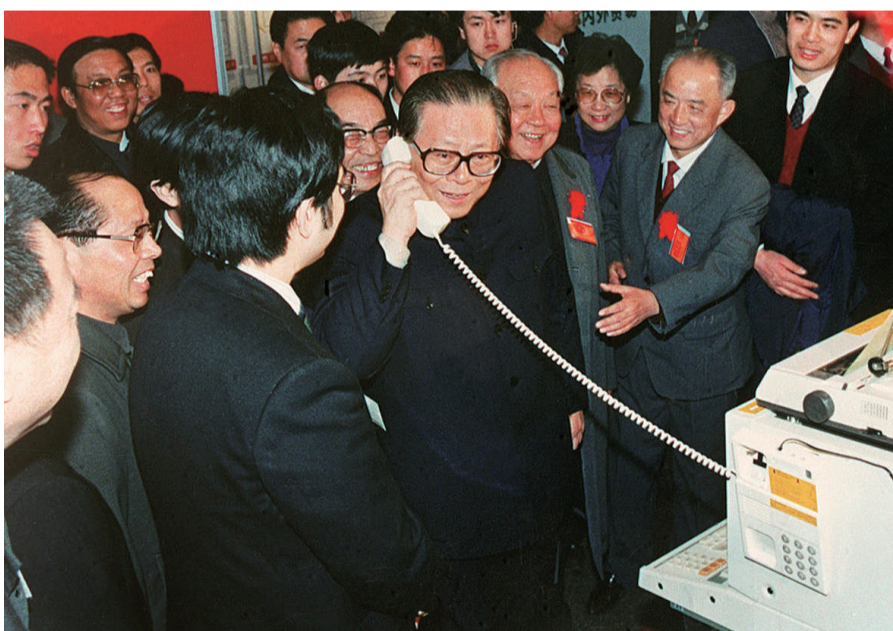
上图:1984年5月,江泽民同志在北京展览馆举行的全国电子新产品展览会上,试用国际长途电话向远方的工作人员问候。