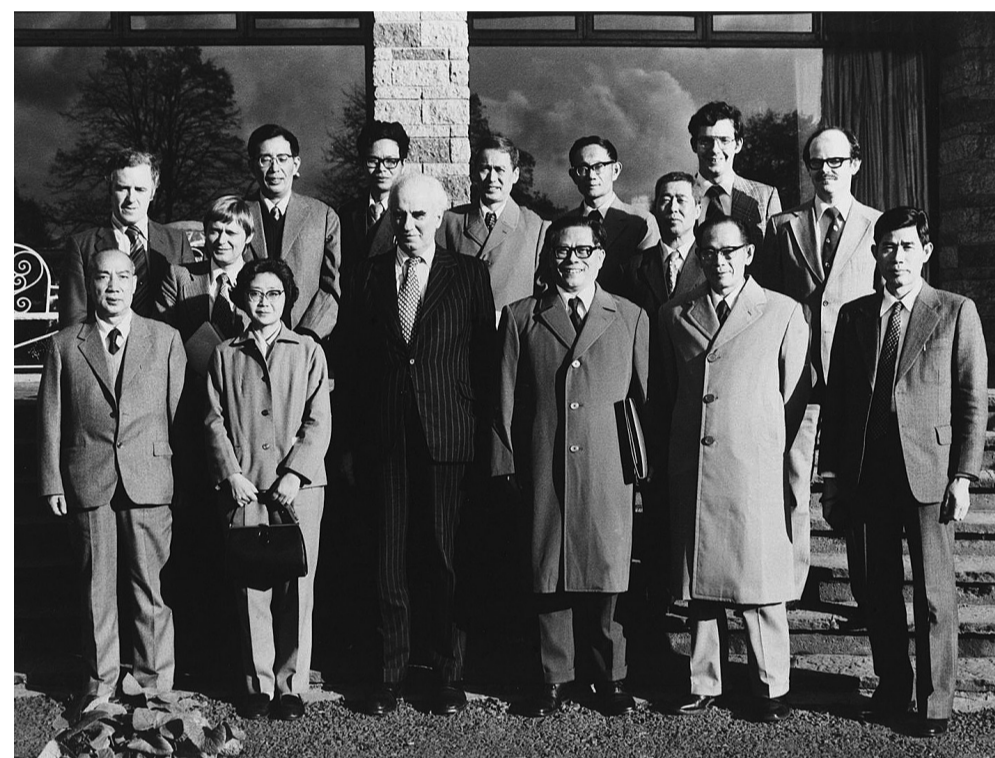
上图:1980年10月底,江泽民同志(前排右三)在爱尔兰香农开发区考察时同开发区负责人等合影。