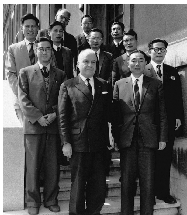
上图:1964年6月,江泽民同志(二排右一)在法国艾克斯莱班出席国际电工委员会会议期间与会代表合影。