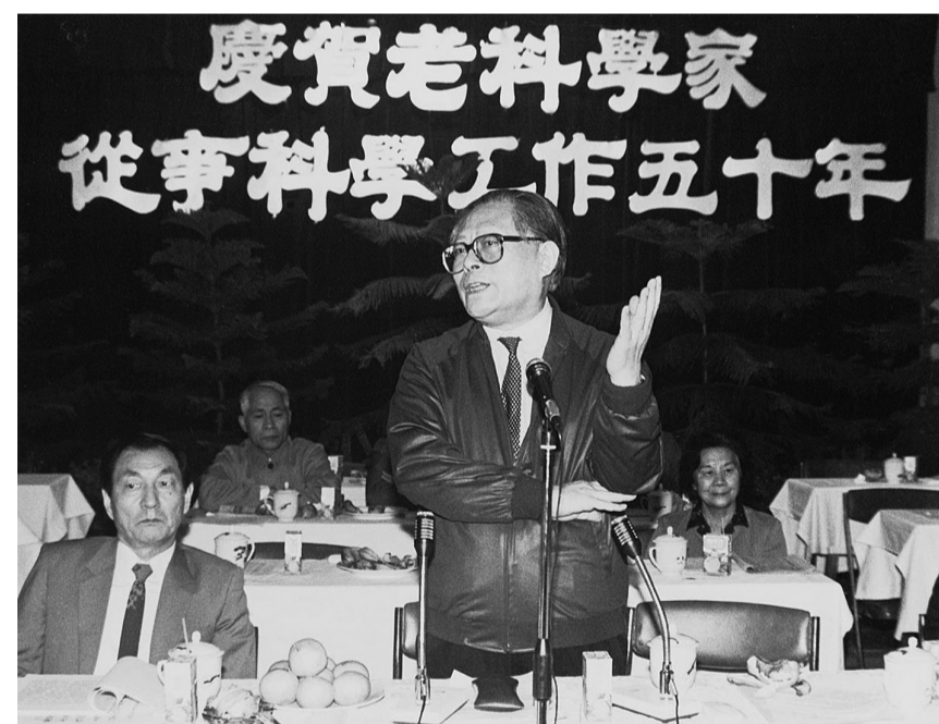
上图:1988年10月,江泽民同志在上海庆贺老科学家从事科学工作五十年座谈会上讲话。