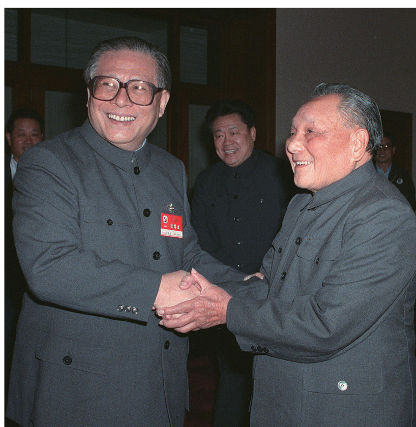
右图:1989年11月6日至9日,中国共产党第十三届中央委员会第五次全体会议在北京召开。这是邓小平同志和江泽民同志亲切握手。