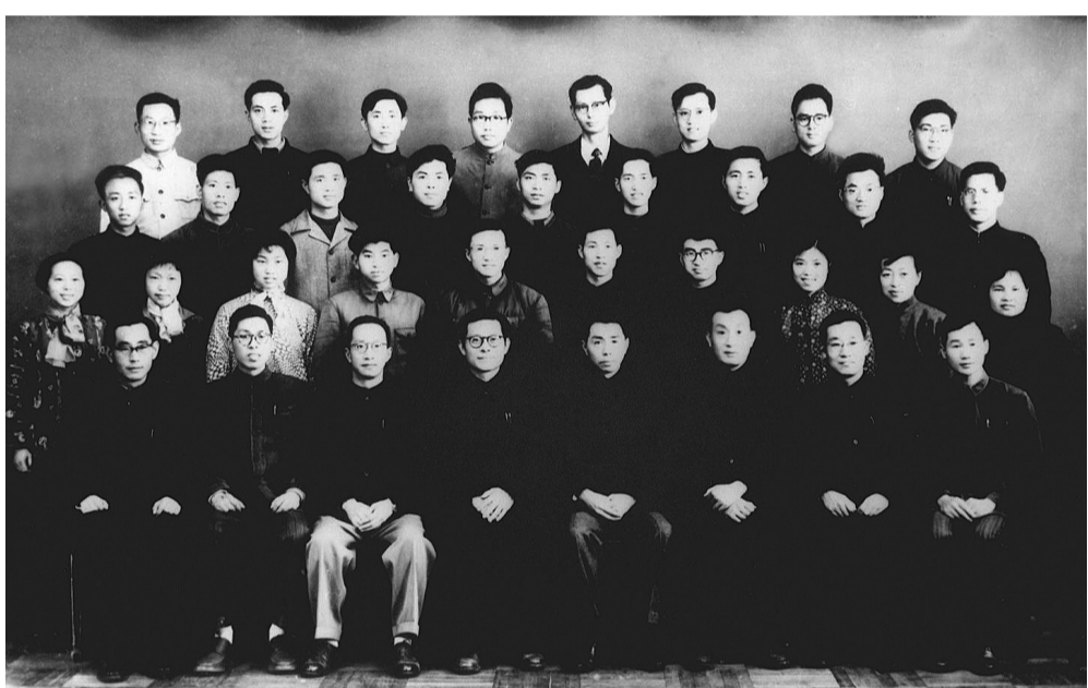
上图:1963年3月,江泽民同志(前排右五)在上海同小型三相异步电机全国统一系列设计领导小组成员合影。