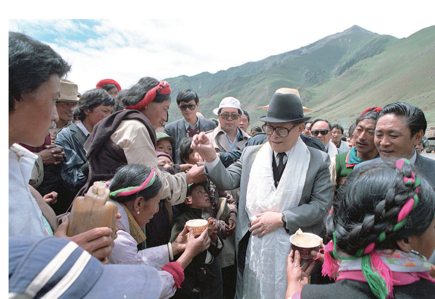
上图:1990年7月25日,江泽民同志与藏族群众共庆望果节。