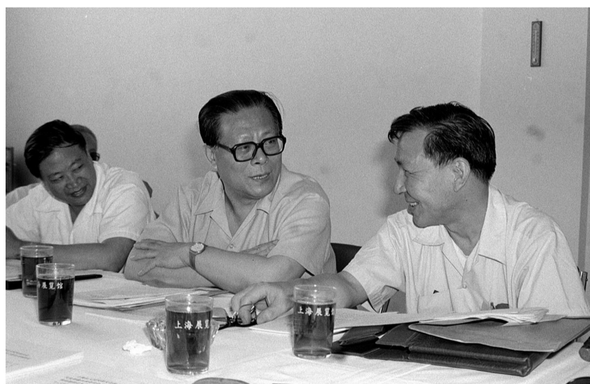
上图:1985年,江泽民同志在上海市八届人大四次会议上。