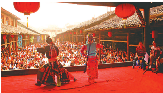
罗城古镇的“慢时光”

十年岁月铸就辉煌过往,实干笃行续写崭新篇章。面向未来,犍为县将坚决扛起市委赋予的“建设市域副中心”重大使命,围绕“一心一地一城”发展定位,坚持“工业强县、文旅兴县”发展战略,踔厉奋发、笃行不怠,以大干快上的“犍为状态”,跑出跨越腾飞的“犍为速度”,奋力谱写全面建设社会主义现代化国家犍为新篇章。