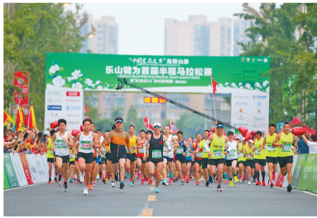
犍为首届半程马拉松比赛起跑