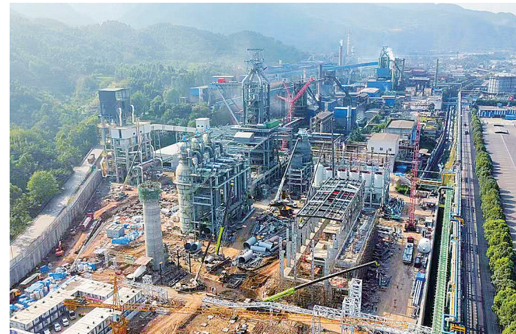
德胜1250立方米高炉及配套项目快速推进

本报讯(吴俊璋 冯丹远 记者 杨心梅 文/图)紧紧围绕“重大产业项目攻坚年”经济工作主题,2022年,沙湾区把重大项目建设作为加快发展的“压舱石”,计划投资33亿元,实施省市重大项目建设31个。今年1至8月,已完成投资21.1亿元,占年度计划的68.9%,全区重点项目建设交出了亮丽的成绩单。