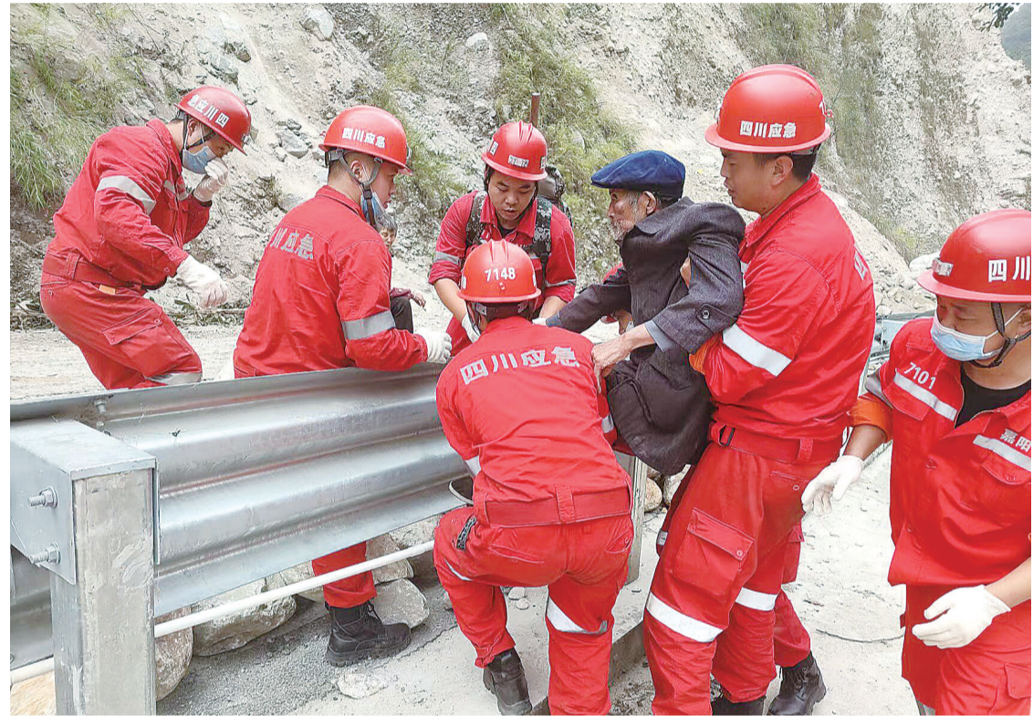
队员们帮助行动不便的老人向安全区域转移

对该村住户进行逐户排查,全方位搜救遇险人员、进行房屋排危,不漏一户,不漏一人。当日下午,在返回驻地途中,队员们发现有村民受伤,他们立即拿出随身携带的救护包,为受伤人员进行止血包扎,使受伤人员得到及时救助。途中,他们还积极帮助行动不便的老人向安全区域转移。