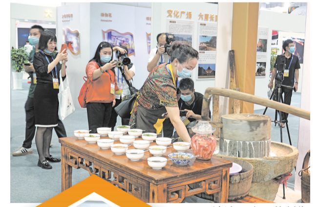
沙湾石磨豆花制作