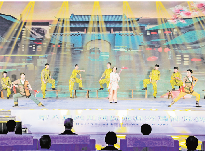
开幕式文艺表演《人间烟火》