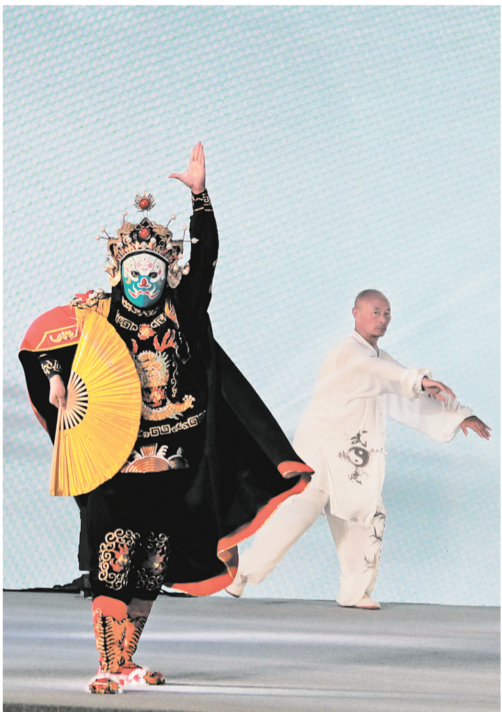
开幕式文艺表演《佛国仙山》