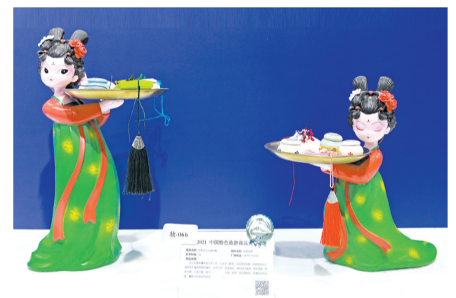
专为女性设计的旅游商品成为本届旅游商品大赛的亮点