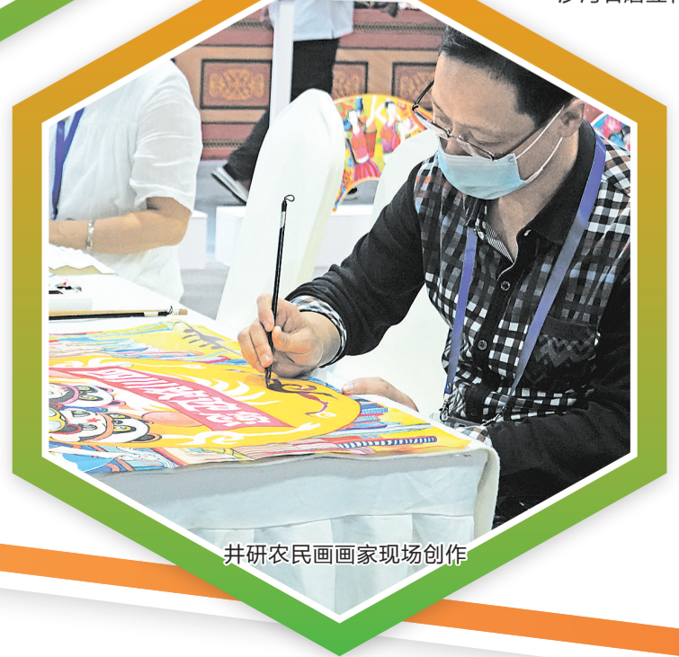
井研农民画家现场创作