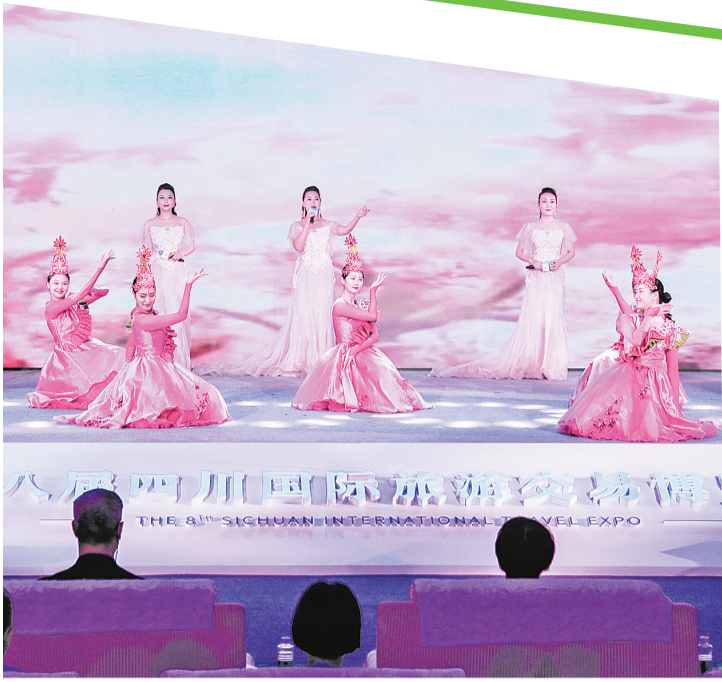
开幕式文艺表演《海棠花开》