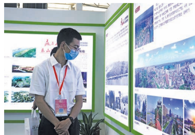
参会嘉宾观看乐山展馆