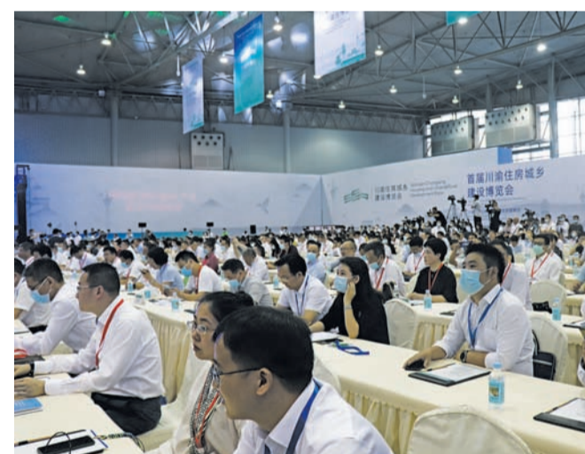
川渝两地参会嘉宾聆听系列高峰论坛