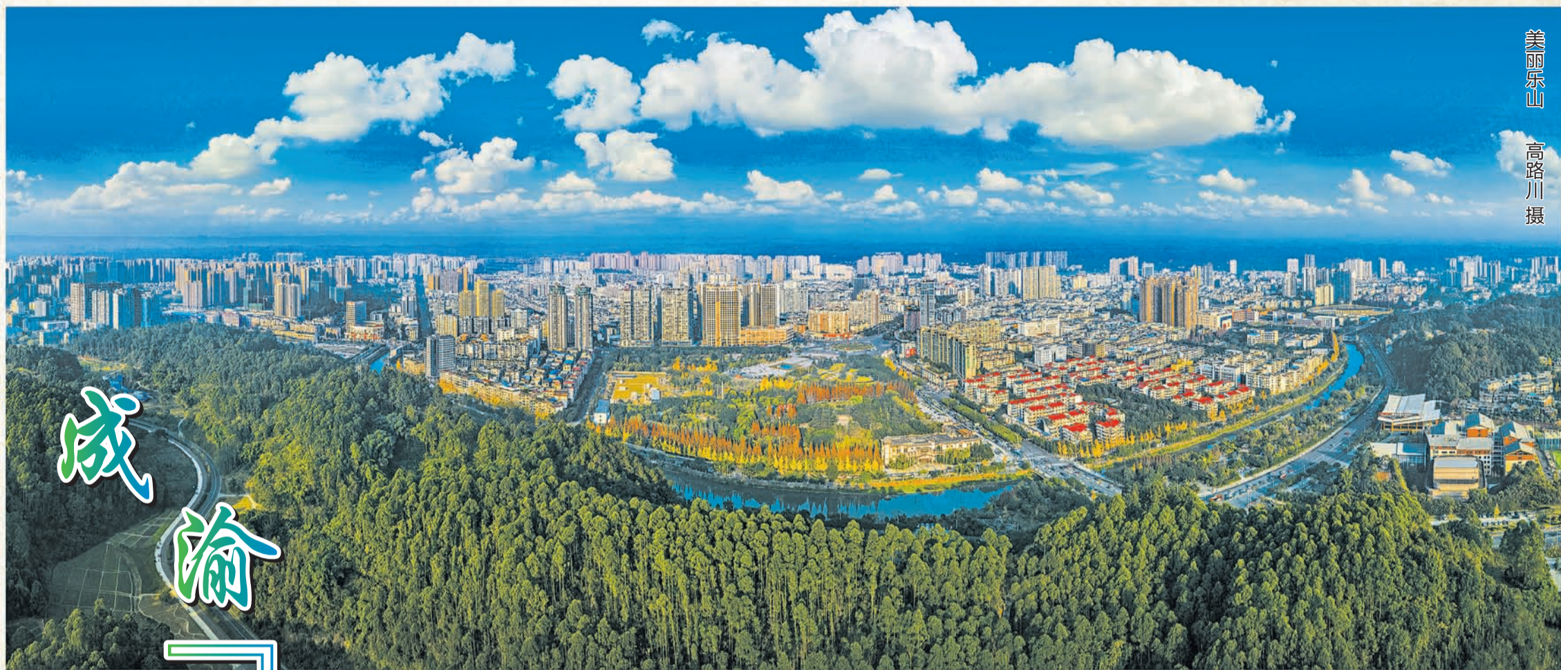
美丽乐山