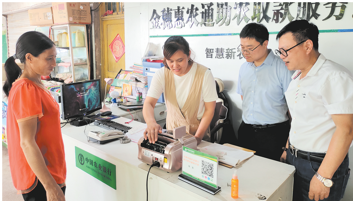
日前,农业银行井研支行召开“2021年助农业务培训表彰会”,以激励各惠农金融服务站(点)工作人员,在乡村振兴中大显身手。近年来,该行紧紧围绕“普惠民生”做文章,加大服务力度,规划组建助农服务站(点)200多个,布放机具近300台件,联系指定服务人员200多人,便捷群众金融消费支付,竭力解决“最后一公里”难题,取得了显著的社会效益。图为农业银行井研支行工作人员在助农取款服务点调研。

增强社区居民的信用意识。活动还通过游戏、问答和观看线上知识库、网络诈骗防范动画视频、“断卡”行动视频等环节,帮助居民提高风险防范意识。活动现场专门设置了提供各类金融知识的咨询台,解答社区居民提出的各种疑问。兴业银行乐山分行相关负责人表示,今后,该行还将持续开展此类活动,积极履行社会责任,多角度、多形式、多渠道将金融知识送到广大群众手中,提升金融消费者的风险防范意识和能力。