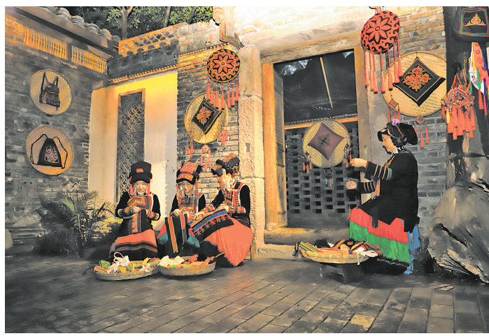
记忆峨边——沉浸式文化演出