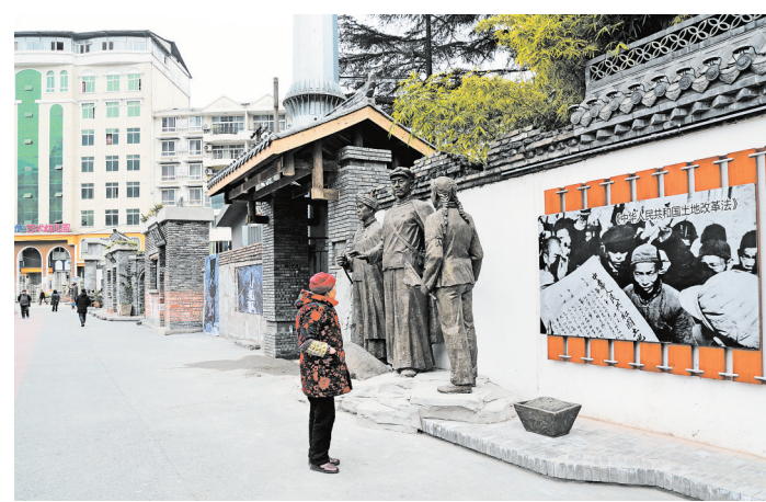
记忆峨边——民主改革