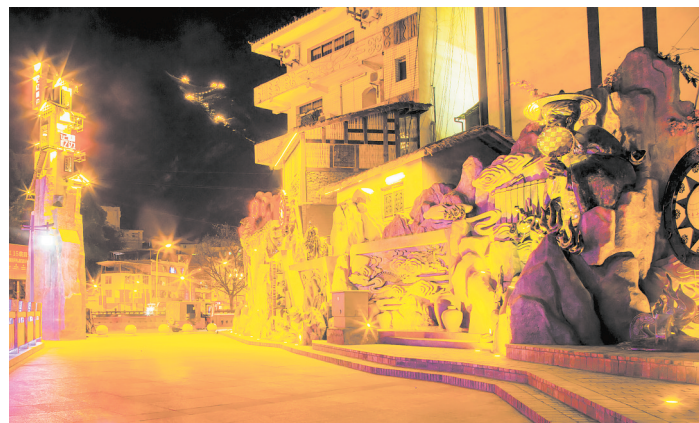
记忆峨边历史文化长廊