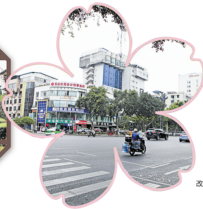
改造后的嘉定北路