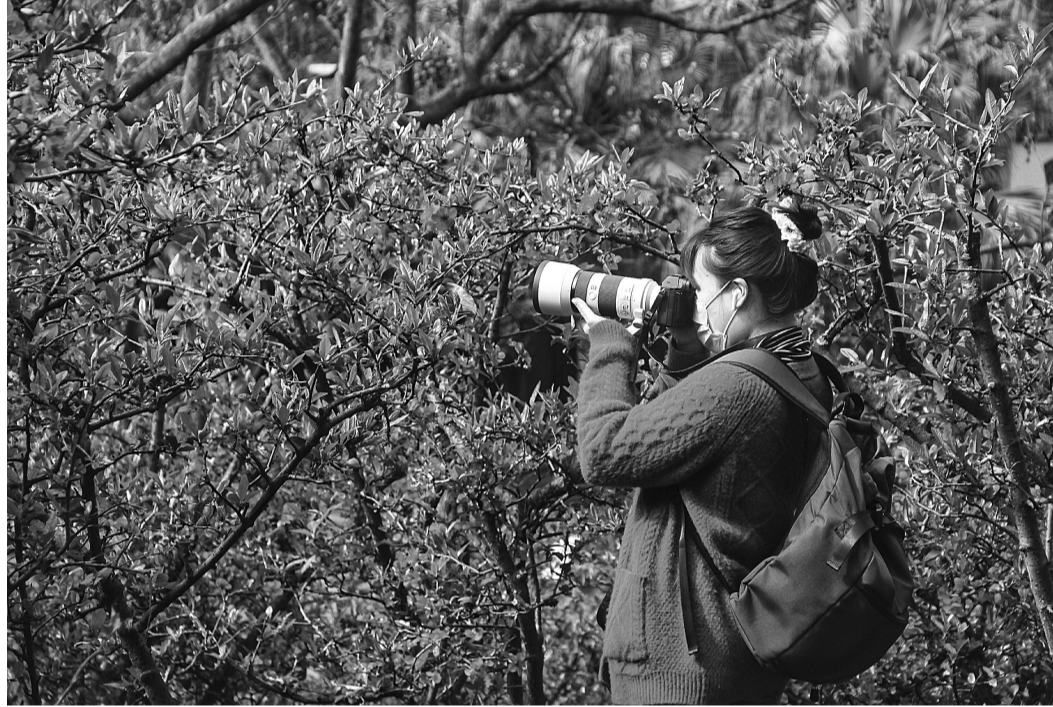
初春时节,乐山大佛景区里的海棠花已静静开放,让春意盎然的景区更添一份活力和色彩。不少游客穿梭在海棠树下,观花拍照,沉醉在浓浓的春色中。