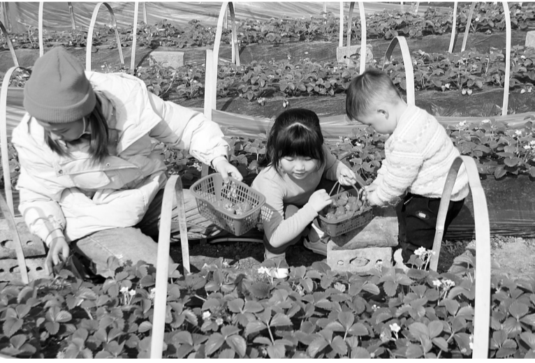
近年来,马边彝族自治县通过“支部+专业合作社+农户”模式,因地制宜大力发展特色种养业,构建精准防返贫长效机制。图为近日该县民建镇红旗社区一特色种植园里,市民体验采摘的情景。

会议听取了省扶贫基金会2020年工作总结报告,观看了乐山市扶贫工作纪实宣传片,乐山市扶贫开发局及市扶贫基金会负责同志在会上作了交流发言。