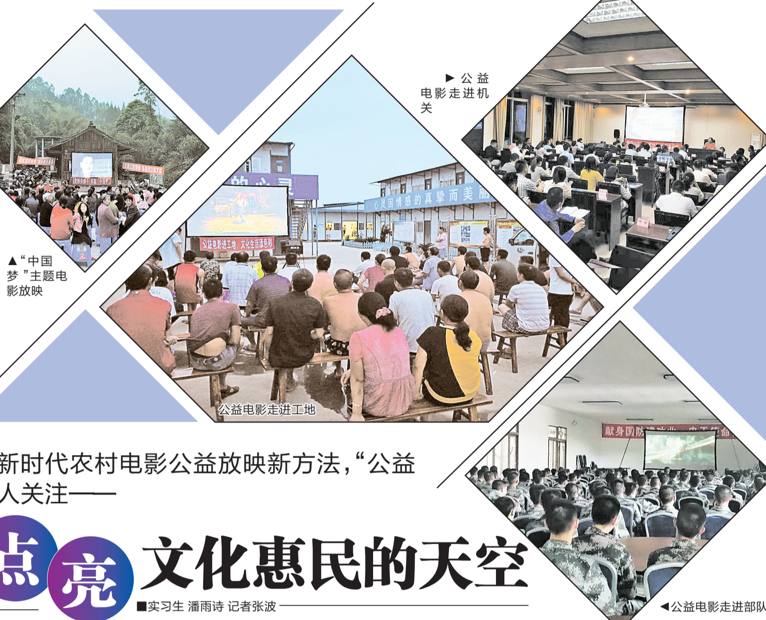
▲“中国梦”主题电影放映

近日,乐山市惠民农村数字电影院线有限责任公司(以下简称乐山惠民电影公司)放映人员来到乐山高新区一建筑工地,为几百名工人放映主旋律电影《中国机长》,观看露天电影的喜悦洋溢在一张张兴奋的脸上。 “十三五”以来,我市农村电影放映工作者坚守初心使命,深入农村,扎根基层,通过电影宣传科学理论和先进文化,成为传播社会主义核心价值观、弘扬社会主义核心价值观的重要力量。我市一直积极探索新时代农村电影公益放映新方法,形成“公益电影+”的乐山模式。近五年间,我市累计放映公益电影12.2万场,惠及群众1345万人次,群众满意度达90%以上。