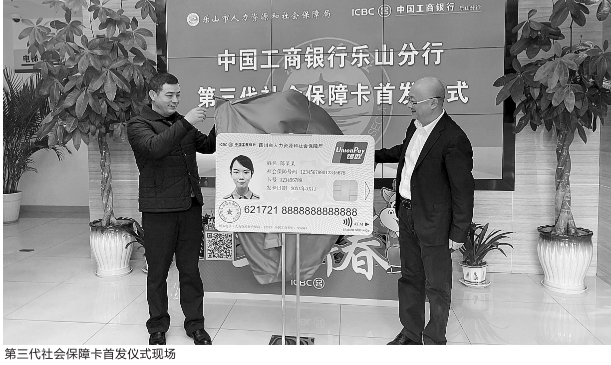
第三代社会保障卡首发仪式现场

据了解,凡在工商银行乐山分行新办并激活第三代社会保障卡的客户,均可领取一张50元的微信立