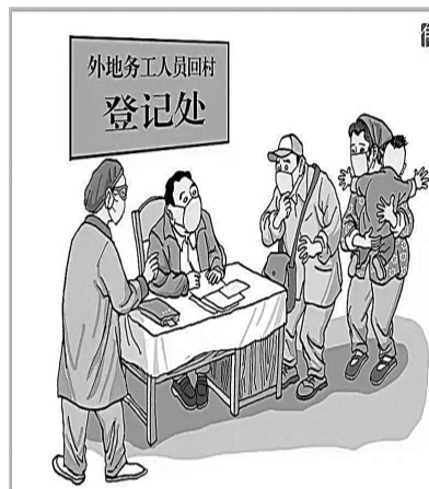
据科普中国网 图片为资料图片