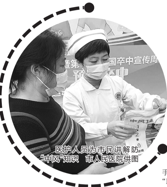
医护人员为市民讲解防“中风”知识

据了解,此次排名依据全国项目医院2020年12月11日“已提交”的档案数据,以任务完成率、干预随访率、高危人群检出率、卒中检出率、年龄偏倚、18—39岁人员完成情况、随访完成情况等7个部分为质控考核指标,赋分并进行综合排名。市人民医院在排名中取得良好成绩,是国家卫生健康委脑卒中防治工程委员会脑卒中高危人群筛查和干预项目办公室对该院院外卒中筛查和干预工作的肯定,标志着我市脑卒中高危人群全流程健康管理模式取得一定成效。下一步,市人民医院将继续发挥国家高级卒中中心的骨干指导作用,把脑卒中高危人群筛查和干预项目辐射向更广范围、更多基层医疗卫生机构,切实降低脑卒中发病率、复发率、致死率和致残率,为人民群众健康保驾护航。