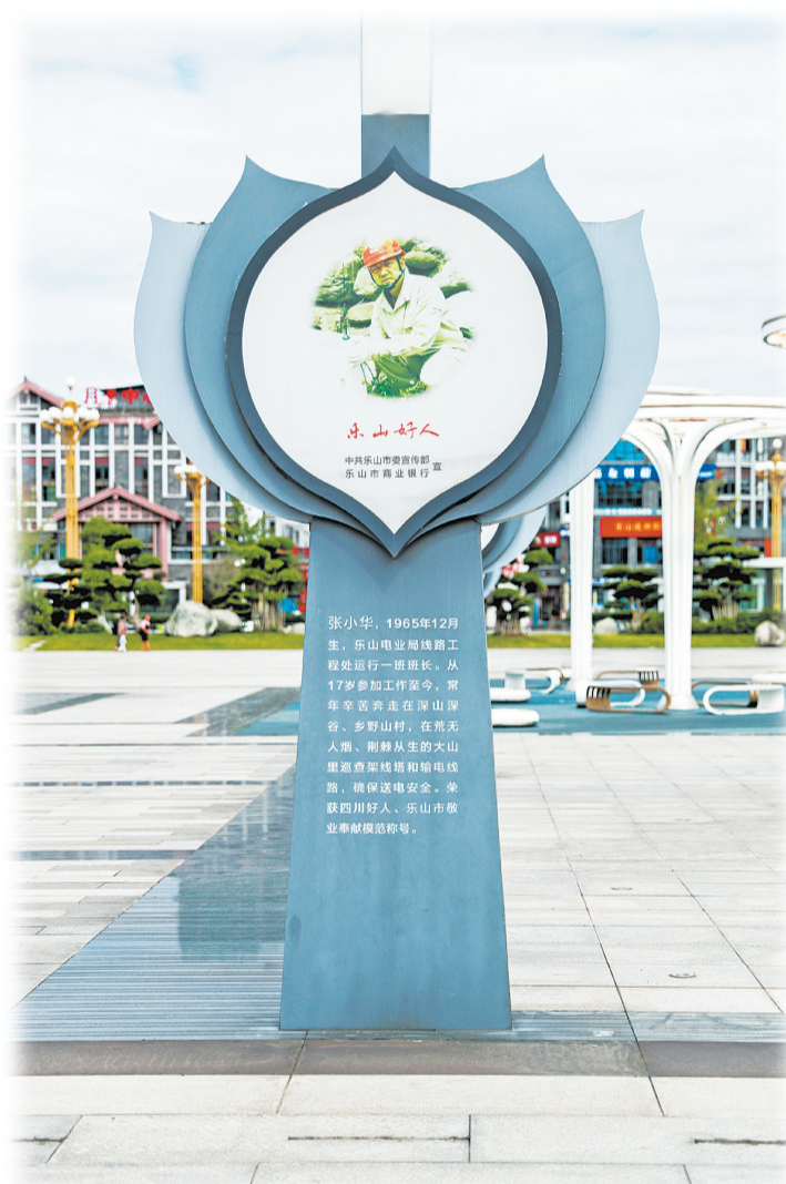
高铁乐山站好人大道