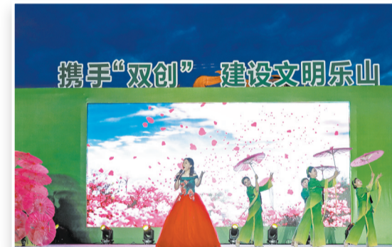
文艺汇演助力“双创”