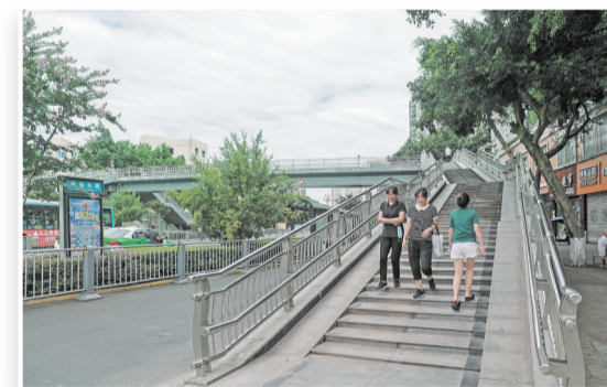
市民过马路走人行天桥