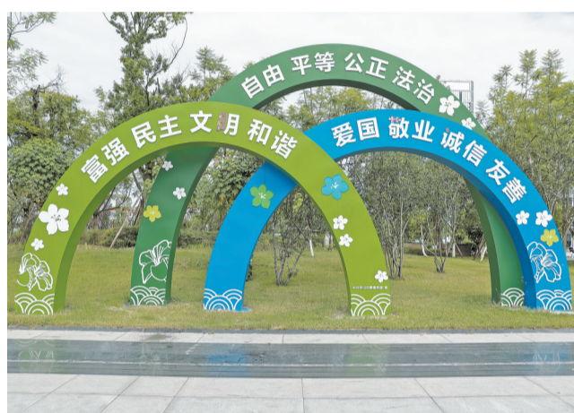
随处可见的社会主义核心价值观标语