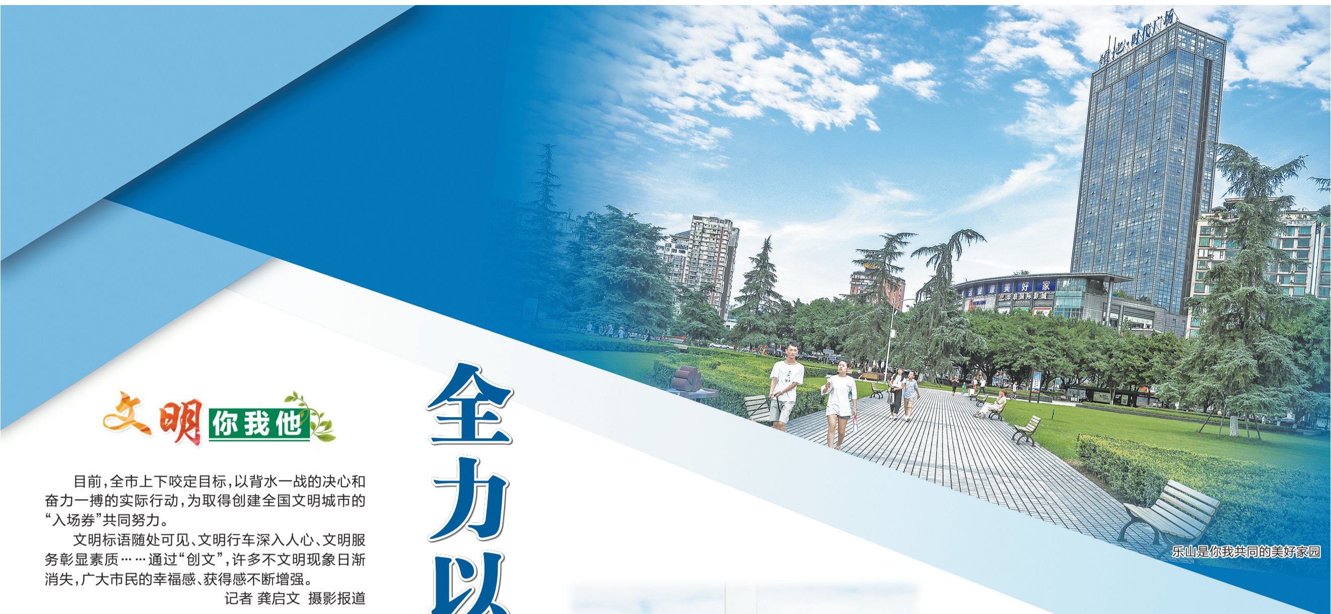
乐山是我共同的美好家园