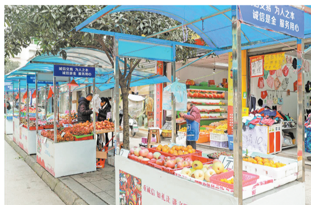
临街摊位规范有序