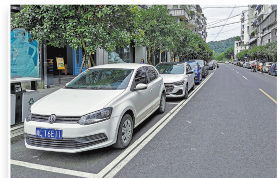
车辆路边规范停放