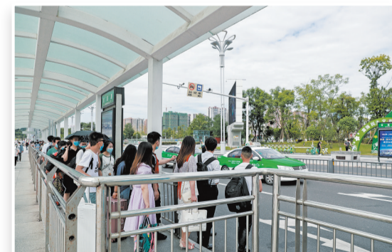
市民游客有序排队候车