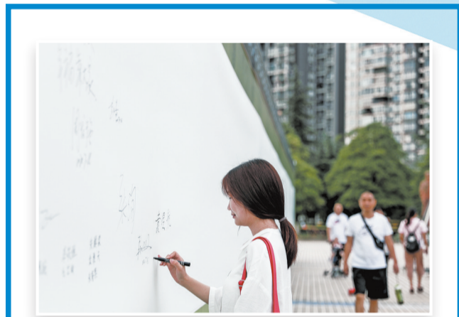
市民签名助力“双创”