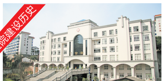
2004年8月18日,现门诊大楼开诊,为六楼一底,建筑面积11225平方米,采用回廊式设计,带中央空调。