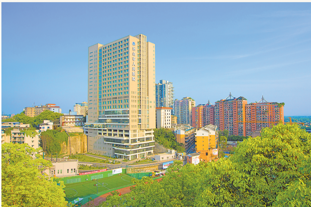
医院全新的综合大楼2014年底投入使用

改革开放40年,乐山市人民医院的点滴变化正是乐山医疗改革发展的缩影。回望她走过的124年的历史,仁爱济世、精诚行医的“乐医精神”,百年传承从未改变,变的,只是为患者的利益不断做出的进步!