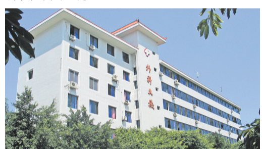
1985年现外科大楼和1989年现内科大楼相继投入使用,大外科、大内科分设,进一步改善了住院条件、加强了学科建设。