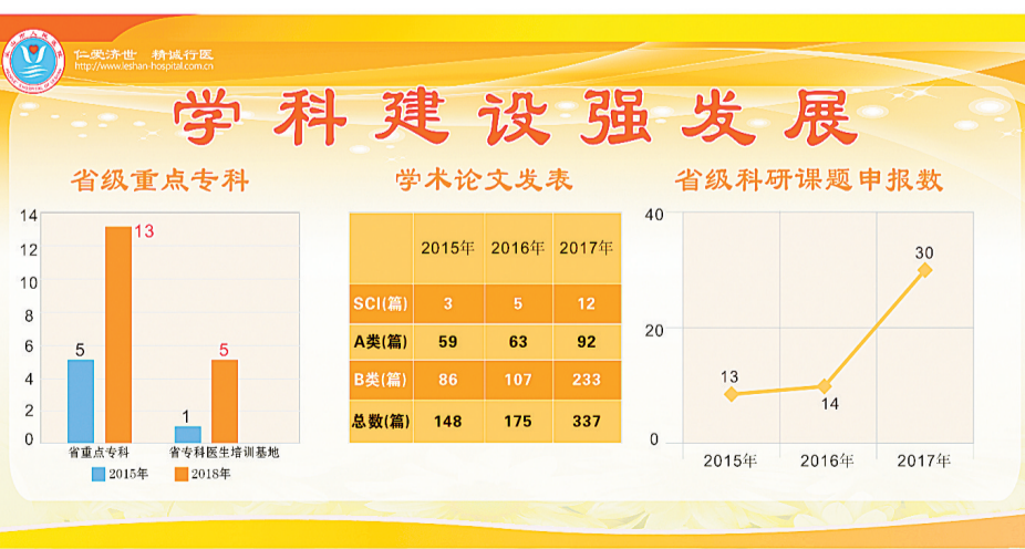
近年来,医院在学术和科研上快速发展。