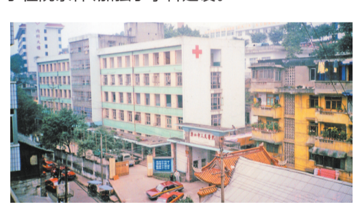
1955年建成的门诊部为一楼一底,面积1200平方米。于1985年拆除重建为五楼一底,建筑面积6512平方米的门诊大楼。