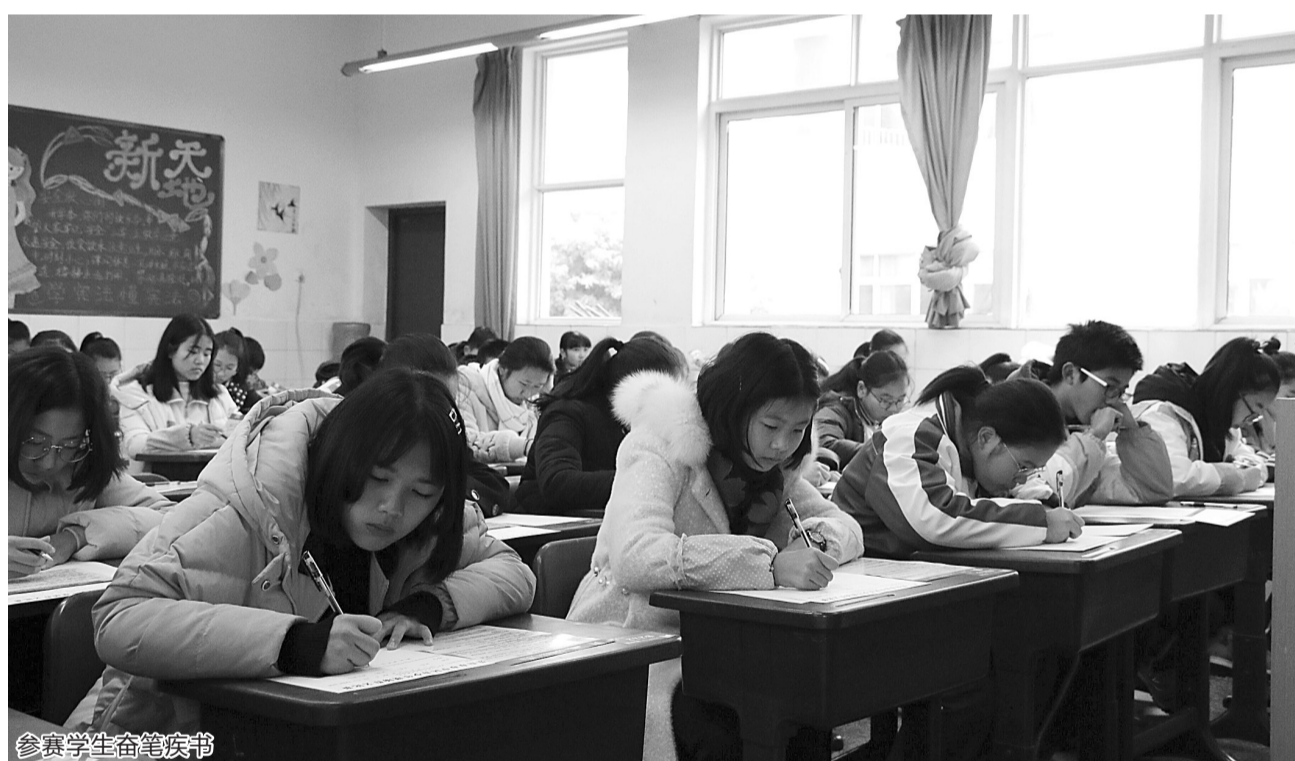
参赛选手奋笔疾书

本报讯(记者 张力 文/图)12月15日上午,由市中区教育局主办,市中区青少年校外活动中心承办的市中区第六届青少年现场作文比赛在市中通江小学举行,56所学校的1500余名学生参加本次比赛。