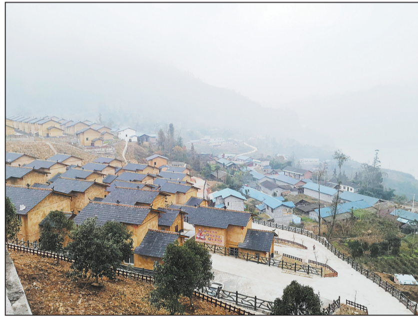
马边彝族自治县苏坝镇白杨槽村易地扶贫搬迁集中安置点