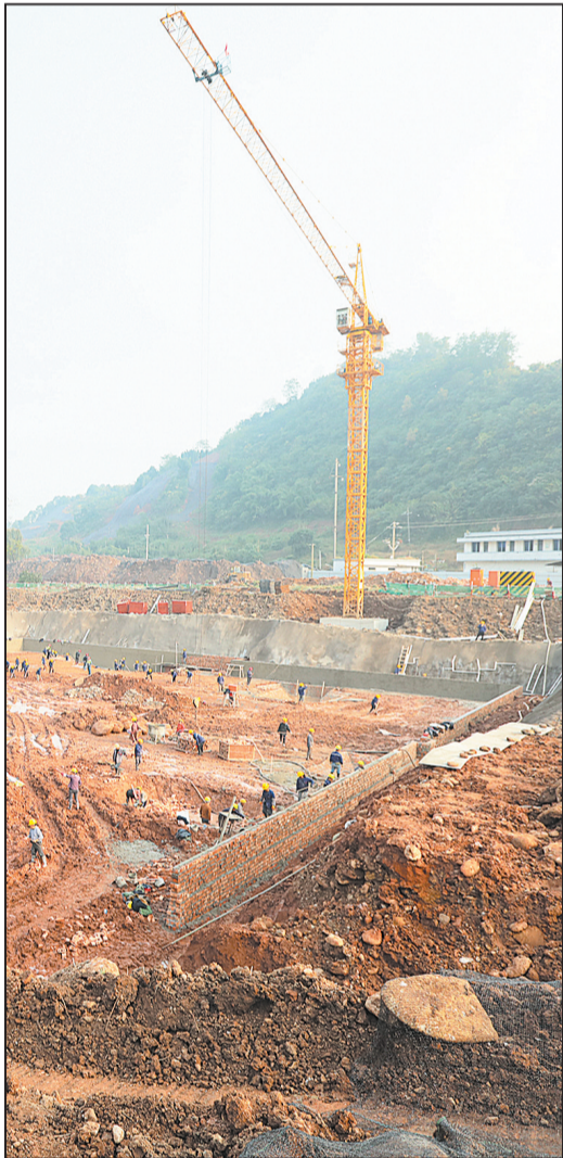
“只有峨眉山”演艺项目剧场预计2019年6月竣工