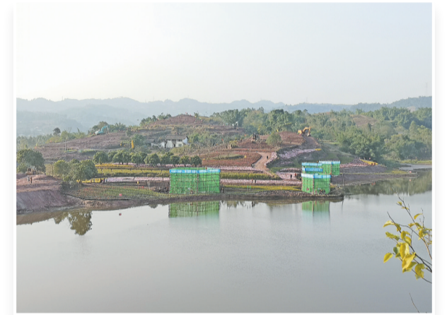
犍为加快建设“世界茉莉之都”