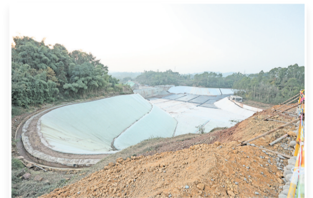
五通桥新型工业基地和邦生物股份有限公司PC项目建设现场