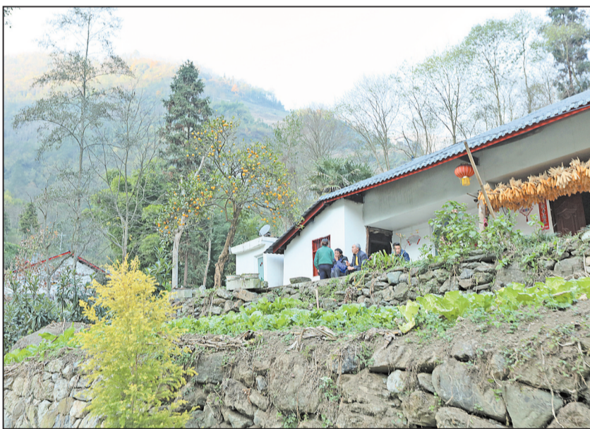
金口河区金河镇曙光村易地扶贫搬迁集中安置点