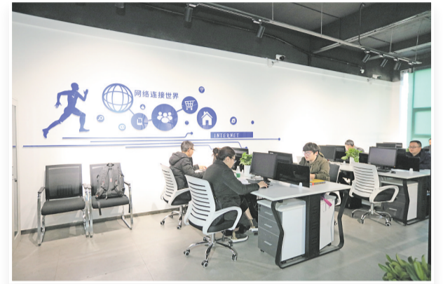
峨边电商·微商扶贫创业中心建成投用