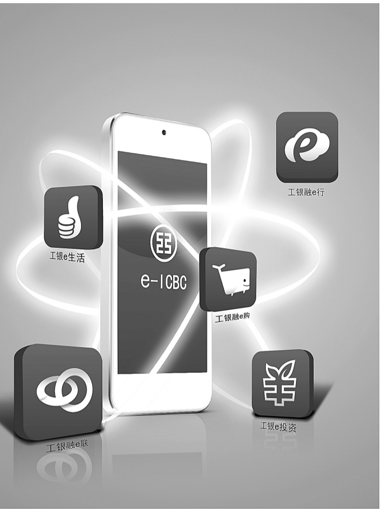
今年工商银行率先发布了其互联网金融品牌“e-ICBC” (资料图片)

“银行不再是要去的地方,而是随时随地的服务。”在移动互联网的浪潮下,这个梦想已经成为现实——今年以来工商银行全面加快互联网金融战略实施,通过三大平台(“融e购”电商平台、“融e行”直销银行平台、“融e联”即时通讯平台)以及三大产品线(支付、融资、投资理财)的建设,不仅实现了自身的转型,更带给了广大市民无限的精彩与便捷。