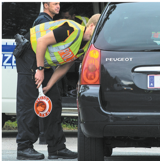
自当地时间9月13日晚17时起,德国警方在德奥边境公路上设置检查点,重点检查自奥地利境内开往德国、来自东欧地区的车辆。图为9月14日,德国警察在萨尔茨堡附近的德奥边境执勤。

萨拉姆说,叙利亚难民危机已蔓延至欧洲,只有叙利亚政治解决才能实现结束这场危机的政治解决才能结束这场难民危机。他认为,英国作为联合国安理会常任理事国,在中东地区具有影响力,有能力在这方面发挥有效作用。