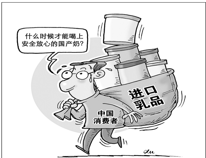
心愿 新华社发 徐骏 作

——法规制度建设取得新进展。乳业整顿和振兴规划纲要、乳品质量安全监督管理条例等20余项规章制度颁布实施,生乳国标等多项乳品质量标准公布,陆续实施促进奶牛标准化规模养殖和振兴奶业首倡发展行动等政策,初步构建了涵盖饲料、良种、牧场建设的政策体系。