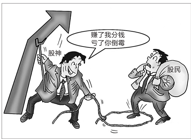
“股神”出没,股民小心。