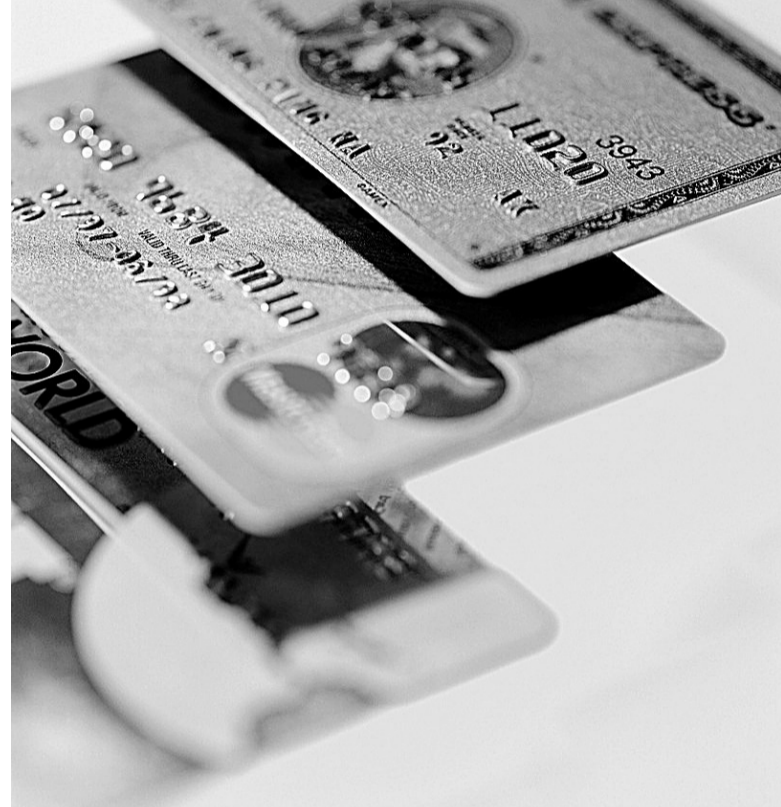
谨慎使用,呵护个人信用

银行专业人士表示,以下情况将在银行留下不良记录:信用卡连续三次、累计六次逾期还款;房贷月供累计2至3个月逾期或不还款;车贷月供累计2至3个月逾期或不还款;贷款利率上调,仍按原金额支付“月供”,产生欠息逾期;水、电、燃气费不按时交款;个人信用卡出现套现的行为;助学贷款拖欠不还款;“睡眠信用卡”不激活还是会产生