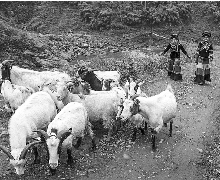
金融扶贫助彝区群众养殖致富